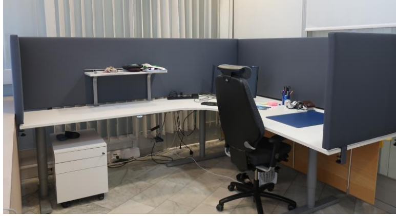
Yeseco Collections | Transmute- seinäpaneeli